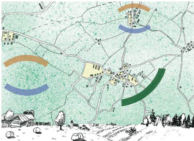
Fig. 5: Objectif de qualité paysagère spécifiques 10: Paysages à dominance rurale – accorder la priorité à l'utilisation adaptée au site.