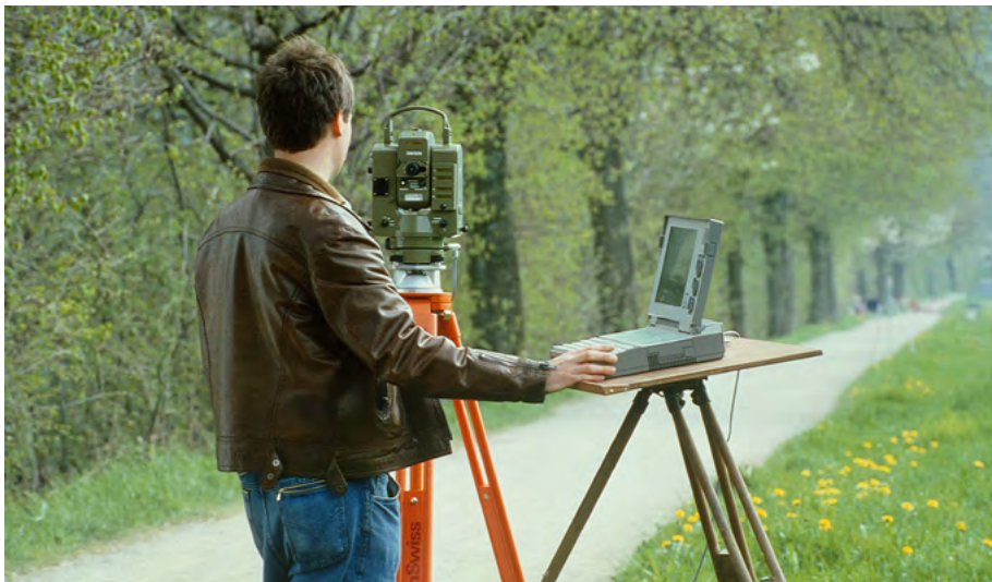
Abb. 3: Totalstation mit Theodolit E 2 und Distanzmesser DM 504 mit verbundenem Laptop zur Datenverarbeitung, Ende der 1980er-Jahre. (Stadtmuseum Aarau, Sammlung Kern).

auch der Name Kern abgeschafft. Die Aarauer Konzerngesellschaft heisst nun Leica Aarau AG. 8 Am 29. Januar 1991 kommt Markus Rauh, der Vorsitzende der Konzernleitung, nach Aarau. Er hat schlechte Nachrichten im Gepäck. Leica Aarau AG wird geschlossen, die Produk-