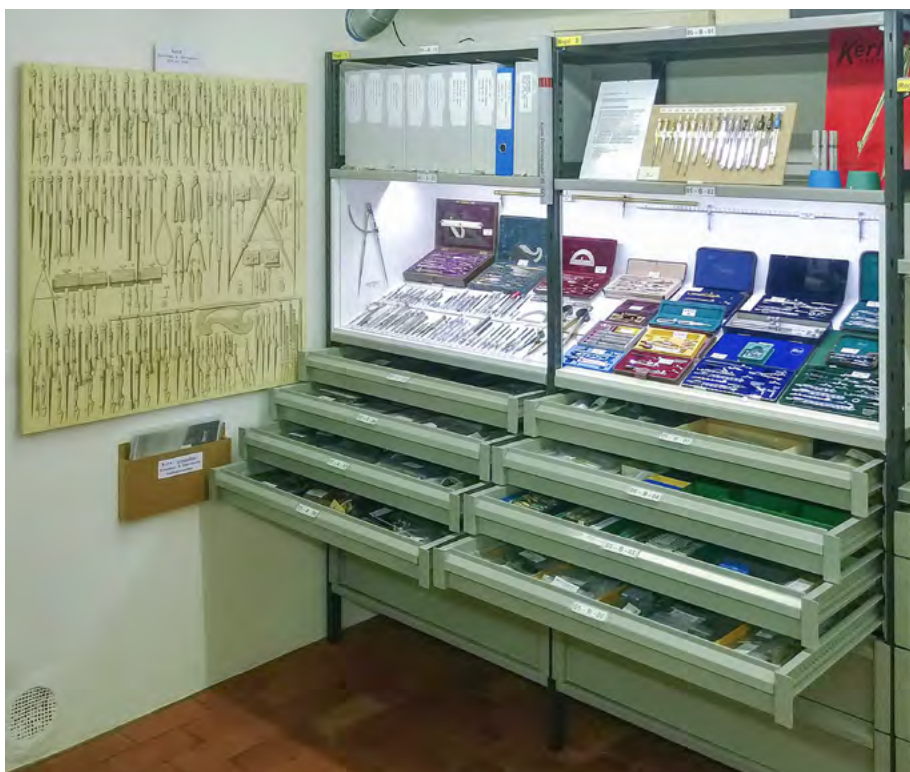
Abb. 4: Ein Blick in die Studiensammlung Kern: Einzelinstrumente und Sets aus der Reisszeug-Produktion (Foto Stadtmuseum Aarau, Sammlung Kern).

Die Studiensammlung wird von der «Arbeitsgruppe Kern» aus ehemaligen Mitarbeitenden von Kern, Mitarbeitenden des Stadtmuseums und weiteren Fachleuten erschlossen und unterhalten. Sie konnte in den letzten 30 Jahren durch Schenkungen und Leihgaben erweitert werden. Die Sammlung ist bedeutend, umfasst sie doch nicht nur eine repräsen-