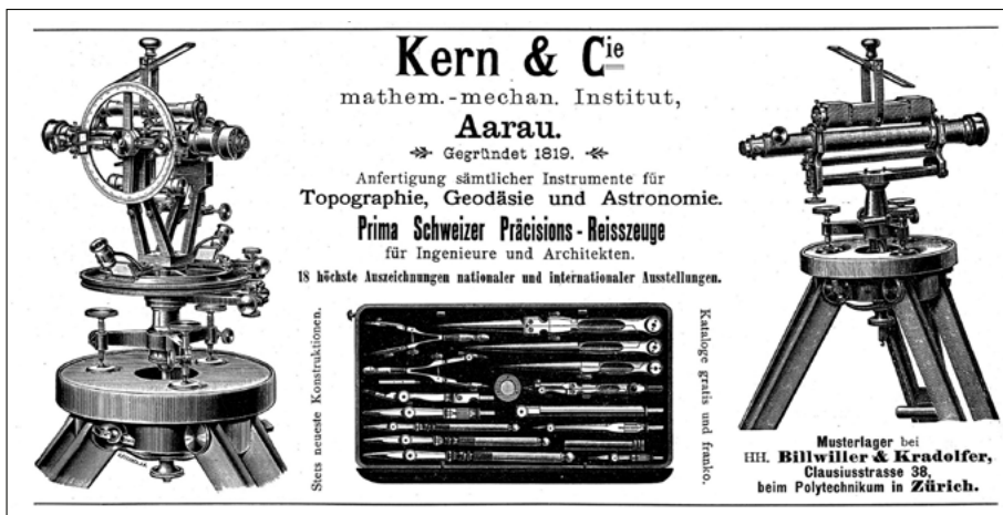
Abb. 1: Eines der ältesten Inserate aus der Schweizerischen Bauzeitung von 1899.