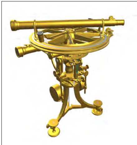
Abb. 2: Der texturierte digitale Zwilling des Borda-Kreises (Berchtold & Pünter, 2018).

Laien doch eher schwierig. Deshalb war die Idee, den digitalen Borda-Kreis-Zwilling in einer App auf dem eigenen Smartphone oder auf einem Tablet so zu präsentieren, dass möglichst auch eine Messung simuliert werden kann.