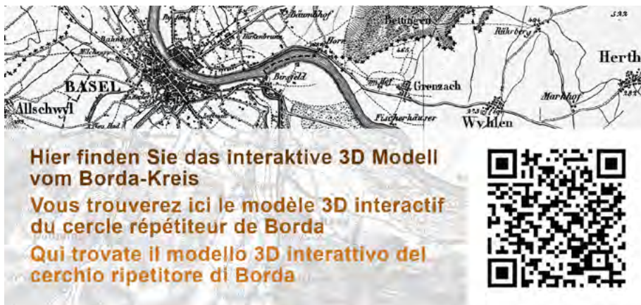
Abb. 5: QR-Tag scannen, um die App zu installieren.

phones und Tablets sind performant genug, um mit einer entsprechenden App künstliche Objekte im Livestream der Kamera darzustellen. Somit sieht man auf dem Display live die von der Kamera aufgenommene Realität, welche beliebig erweitert, also augmentiert, werden kann. In der Bachelorarbeit entstand ein komplett modellierter digitaler Zwilling des Borda-Kreises sowie eine Smartphone- und eine Tablet AR-Applikation für iOS- sowie Android-Geräte. Das erstellte Modell des Borda-Kreises kann für zukünftige Anwendungen oder weiterführende Arbeiten verwendet werden. Für