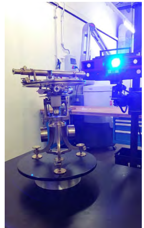
Abb. 1: Der Borda-Kreis der Sammlung Kern vor dem ATOS III Triple Scan bei der Digitalisierung (Berchtold & Pünter, 2018).

Doch wie kann dieses historisch wertvolle Messinstrument dem interessierten Publikum auf eine ansprechende Art und Weise zugänglich gemacht werden? Ein wichtiger Anspruch an die 200yrs Swiss Geo x Veranstaltung war zudem, nicht nur die Geschichte zu beleuchten, sondern auch den Kontext der Gegenwart der Geomatik einzubeziehen. An einem Workshop mit Studierenden der ETH, FHNW und HEIG-VD im März 2018 ist die Idee entstanden, nicht den Bordkreis selber, sondern seinen digitalen Zwilling zu präsentieren. Die Vorteile sind offensichtlich: Digitale Zwillinge können beliebig viele erstellt werden und gleichzeitig bleibt das Original geschützt. Ein weiterer Anspruch war zudem, den digitalen Zwilling interaktiv erlebbar zu machen. Während mit Vermessungsinstrumenten vertraute Fachpersonen sich einigermaßen gut vorstellen können, wie mit dem Borda-Kreis gemessen wurde, ist dies für