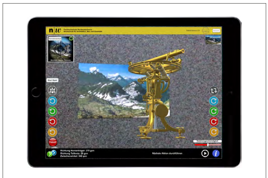
Abb. 4: Die Tablet-App zeigt den Borda-Kreis vor einem Panorama-Image Target. Mit den verschiedenen Knöpfen können die verschiedenen Komponenten des Borda-Kreises einzeln rotiert werden (Berchtold & Pünter, 2018).