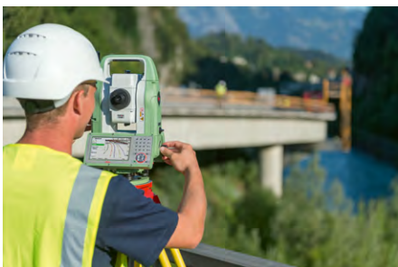
Abb. 1c: Leica Flexline.