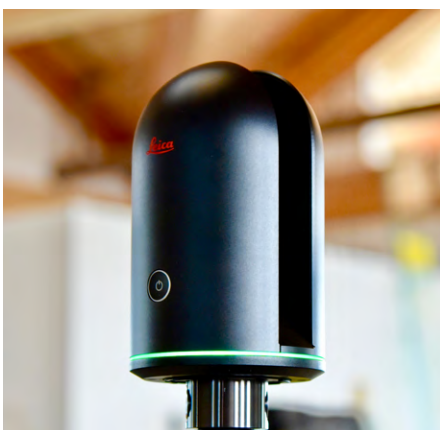
Abb. 2a: Leica BLK360.

Auf den BLK360 folgte der BLK3D, ein einfach zu bedienender, tragbarer 3D-Imager, der genaue bildbasierte Messungen direkt in situ für den Benutzer zugänglich macht.