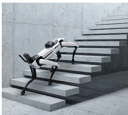
Abb. 4: Leica BLK ARC.

BLK2GO, BLK ARC und BLK2FLY als autonome Realitätserfassungssysteme verbinden sich auch direkt mit HxDR, Hexagons cloud-basierter Kollaborations- und Visualisierungsplattform, indem diese Sensoren ihre Daten automatisch in die Cloud hochladen, dem Benutzer diese Daten anzeigen und es erlauben, diese weltweit zugriffsgeschützt zu teilen. HxDR-Benutzer können hochrealistische Visualisierungen erkunden, indem sie durch einen di-