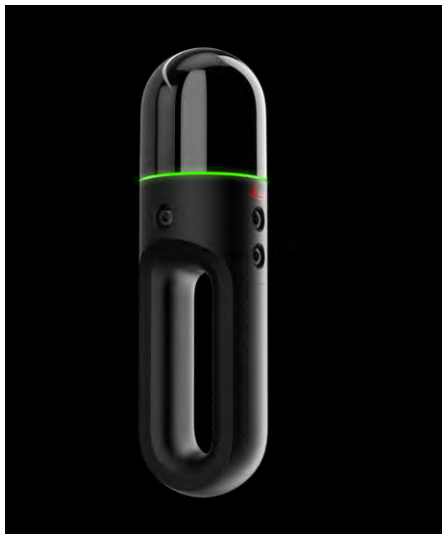
Abb. 3a: Leica BLK2GO.

lung von Ergebnissen, daraus resultierenden Erkenntnissen und zumeist visuellen Darstellungen.