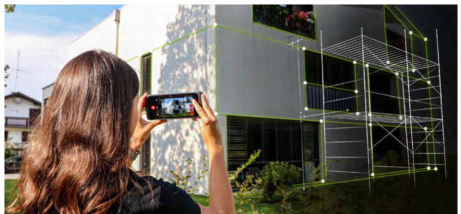
Abb. 2b: Leica BLK3D.