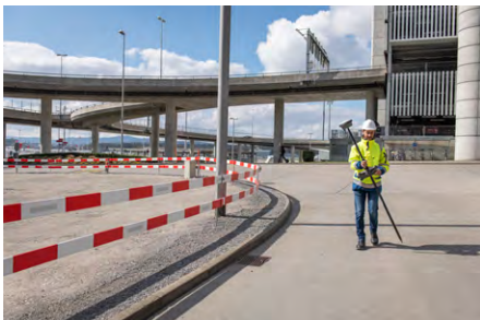
Abb. 1b: Leica GS18L.