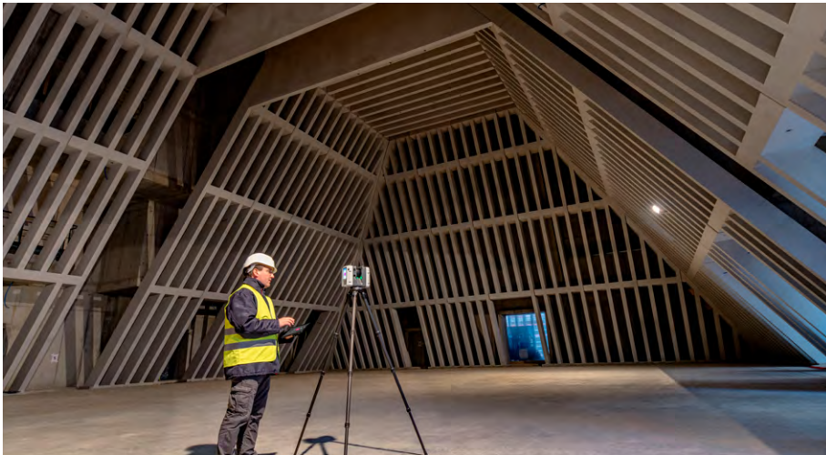
Abb. 1a: Leica RTC360.