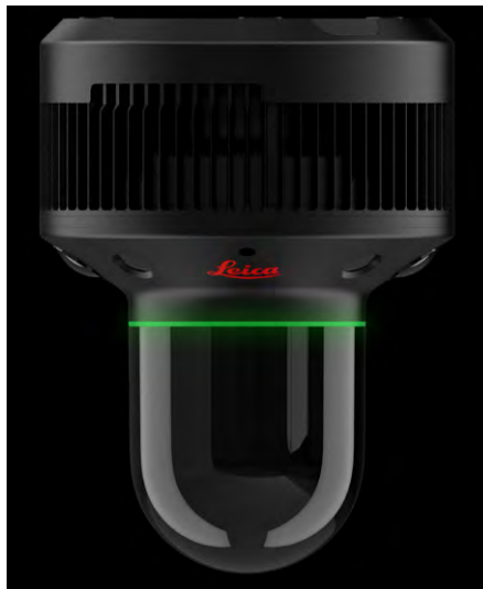
Abb. 3b: Leica BLK247.

BLK2FLY ermöglicht es Benutzern, komplexe Gebäude und Strukturen vollständig zu erfassen, von Fassaden bis zu Dä-